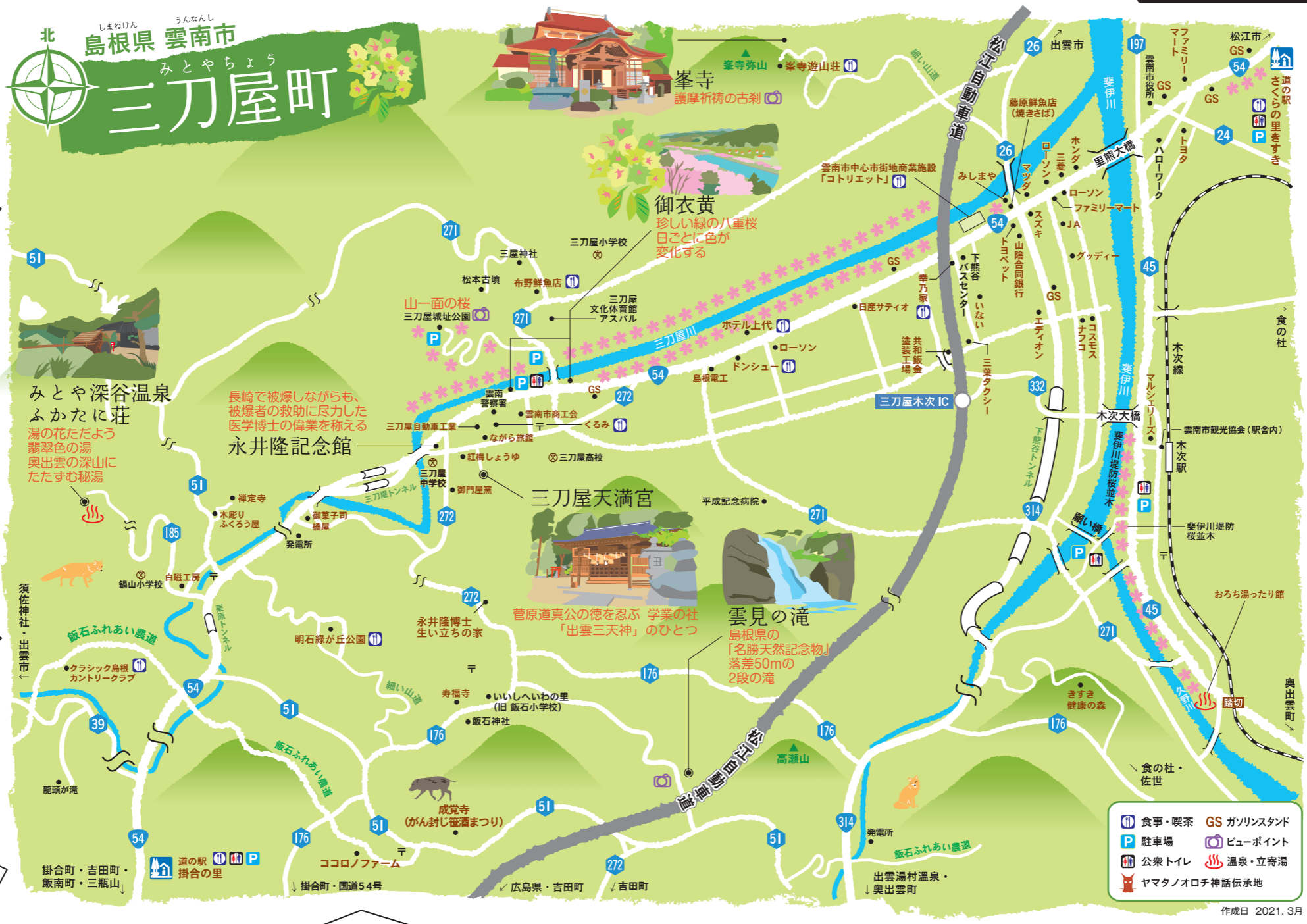
作成日 2021. 3月