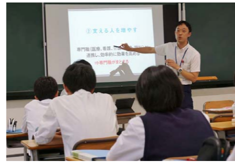
テーマに関する講義

三刀屋高校では、「未来創造探究」として地域の課題を知り、改善にむけた提案を行う探究活動を行っています。一年生は「未来創造探究I」として、あらかじめ決められたテーマの中から興味があるテーマを選んで、グループで探究活動を行いました。 まず、六月に市役所や地域の事業所で働く方をお招きして研究テーマに関する講義を聞いた後、基礎的な