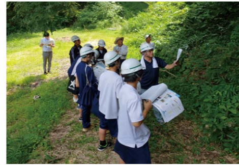
フィールドワーク