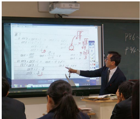
生徒の問題演習の宿題のノートを示して解答・解説を行う（1年 数学I：三角比）

島根県立三刀屋高等学校 〒690-2404 雲南市三刀屋町三刀屋 912-2 TEL: 0854-45-2721 FAX: 0854-45-5630