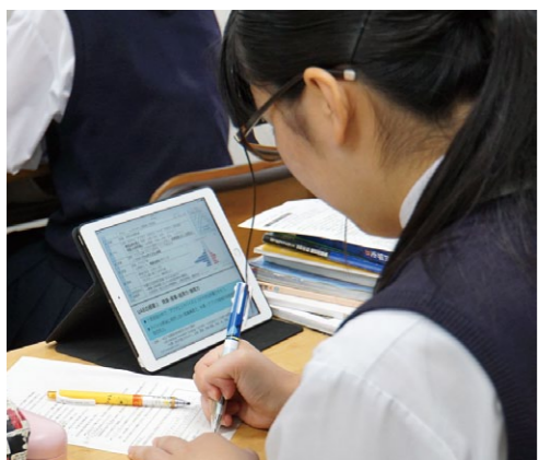
「イスラム教」に関するトピックをiPadで検索してまとめる（2年 地理A：東南アジア）

三刀屋高校は今年で創立九十四年を迎え、昭和四十六年に竣工した現在の校舎も築四十七年となりました。これまで平成十六年の教室棟耐震補強工事、平成十七年の総合学科棟の竣工、平成十八年の教室冷房設置などを行ってきましたが、昨年度からは校舎の長寿命化を目的としたリフレッシュ工事を進めています。