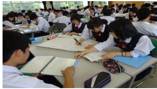
↑調べたことや考えたことを模造紙に まとめていきます