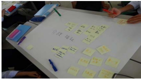
↑まずは、付箋に意見を書いていきます 何を書いても否定しないのがポイント！