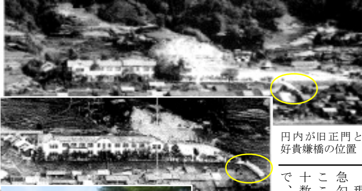
円内が旧正門と好貴嫌橋の位置