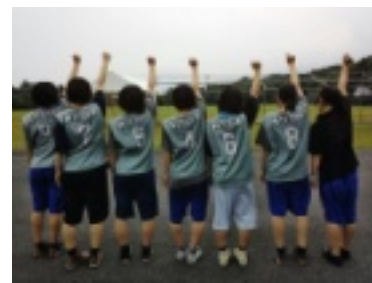
大山に向かって新チームの健闘を誓う

はAの部のみ。最大55名まで出場できるAの部に参加した三刀屋高校だが部員は現在37名。音量ではどうしても部員数の多い学校が有利だ。