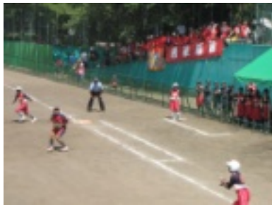
少ないチャンスを生かせず敗退

しばらく遠ざかっている全 国一勝を狙っていたが、対戦 相手は今大会の優勝校。健闘 むなしく初戦突破はならなかつ た。