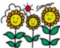
お疲れサマーでした