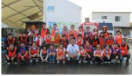
南三陸町災害ボランティアセンターで