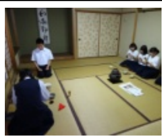
オープンキャンパスでは、記念館の「三楽庵」に多くの見学者が訪れた。

しました。また色んな所でやりたいです。」と感想を語ってくれた。最初は寂しい訪問になるかと思われたが、皆さんに喜んでいただき感謝の訪問になったようだ。