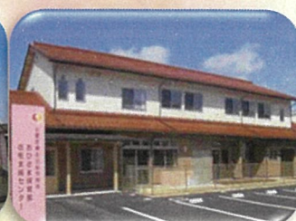
在宅支援センター