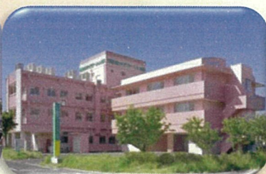
出雲市民リハビリテーション病院