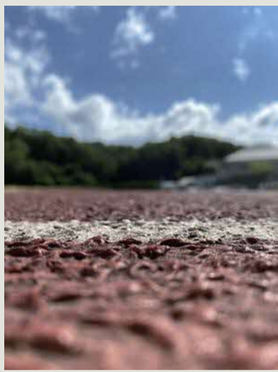
1年 坂本菜生 「スタートライン」