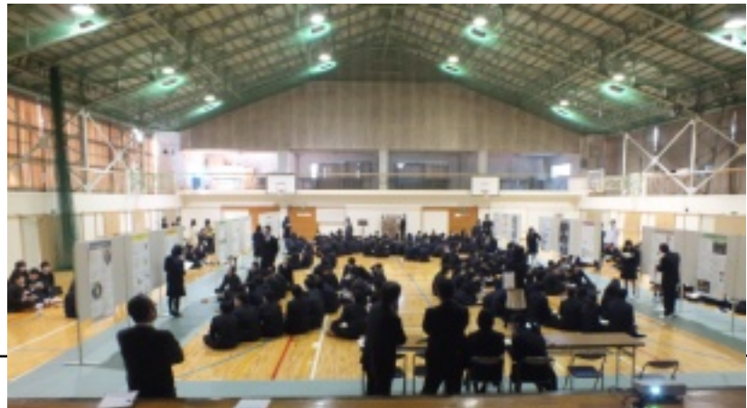
2年生が課題研究の成果を発表したポスターセッション (3/15、本校体育館)

▼編集長からの提言 日常的にマスクをする皆さんが多くなってきましたが、公的な場、例えば各種発表会等でマスク着用のまま発言する姿に、やや抵抗感を感じます。せつかくの発表、発言が聞きづらくもあり、残念です。人前での発表の際には、マスク無しで臨んでみませんか？