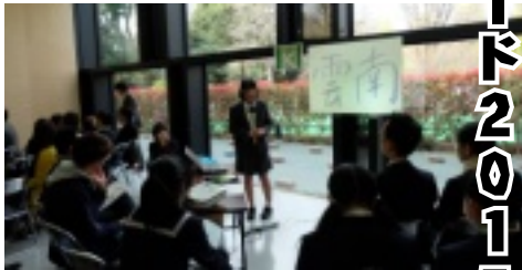
大東高校の皆さんもいっしょです↑

仮想の世界ではなく現実世界の中で課題を見つけ、主体的に考え、そして行動する頼もしい高校生が全国で、そして三高でも増えています。新たな気付きを拡げること自体にも逞しさを感じます。