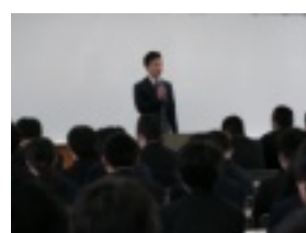
合格体験を語る会

棟平署写とけえ象7日、 大さん合格真ののな名、 講義に合格は、の、ア、失、が、 室(松江江、ド、受、2、 学佐市消、バ、験、年、 科藤防、イ、に、交、生、 。防、ス、向、対、当