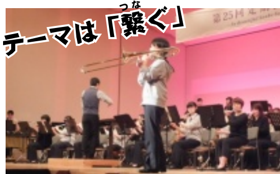
↑毎年、卒業生との繋がりも大切にするステージ