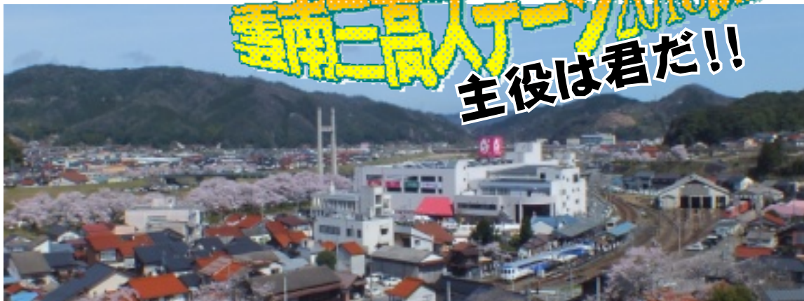
斐伊川土手の満開の桜に迎えられて、トロッコ列車奥出雲おろち号の今シーズン一番列車がJR木次駅を出発(4/2)