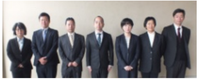
写真右から教科順に紹介します